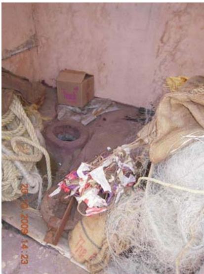
Ecosan toilet - a Junk room

FIN a atteint une notoriété en facilitant la construction de 350 toilettes ecosan à Kameshwaram entre 2006 et 2008 et nous sommes réellement fiers de cet exploit. Kameshwaram a été primé "Nirmal Gram Puraskar" pour sa couverture sanitaire significative. Cependant nous savons que l'usage des toilettes peut être amélioré.