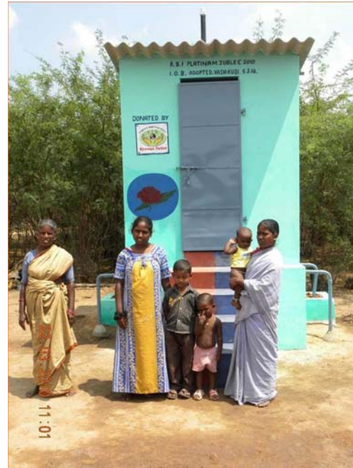
Members of the Family