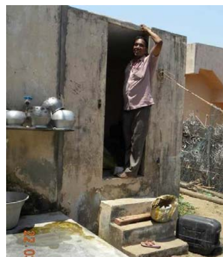
The roof leaky, too low and no doors for toilet

extérieurs. L'utilisation des toilettes entre en conflit avec la notion de virilité masculine, sauf lorsqu'il commence à pleuvoir! Ce qui signifie que les millions de roupies qui ont été dépensées (et le sont toujours) sont pour des toilettes utilisées principalement par des femmes. Deuxièmement, la plupart des programmes d'extension de couverture sanitaire