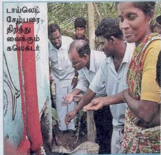
டாய்லெட் சேம்பரை திறந்து வைக்கும் கலெக்டர்